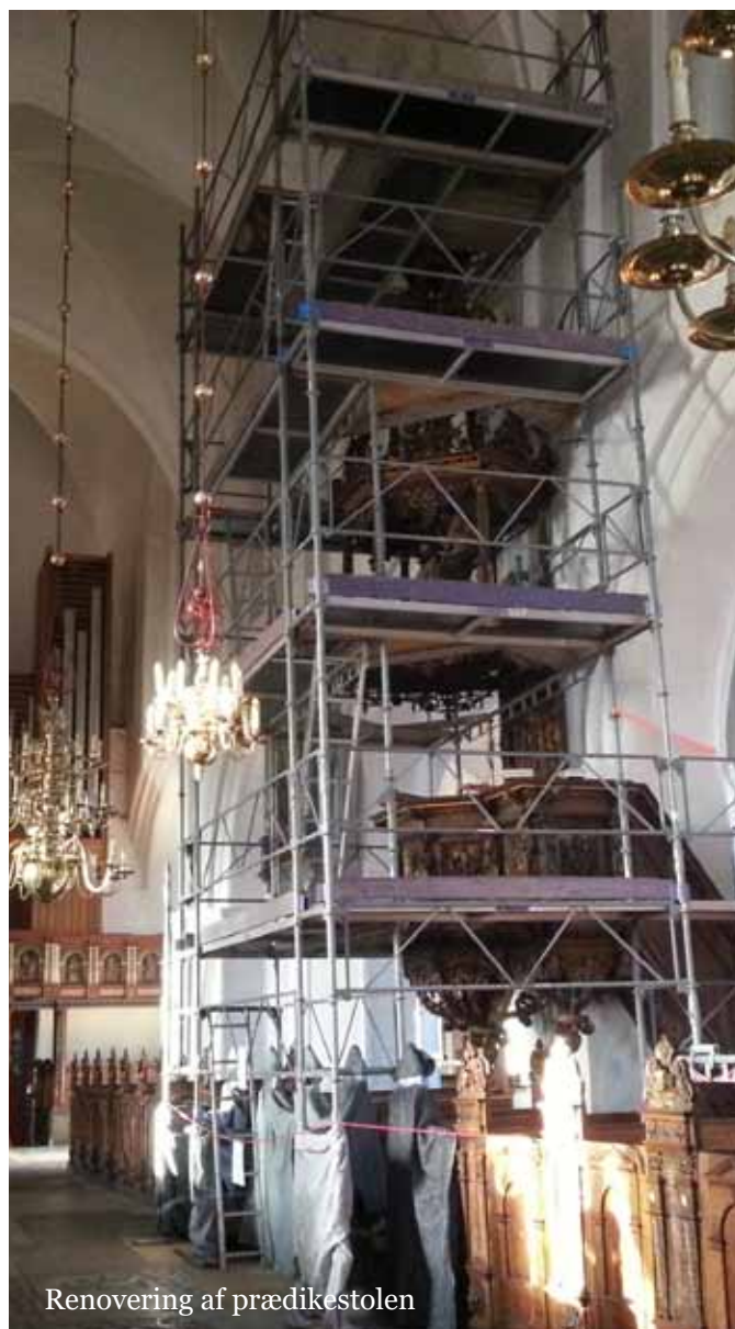
Renovering af prædikestolen