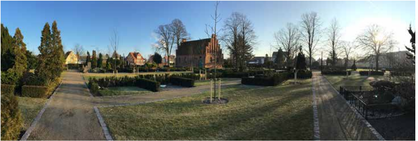
Ny Sct. Nicolai Kirkegård på Sygehusvej 36

Kom til kirkegårdsdag på Ny Sct. Nicolai Kirkegård, hvor du kan møde fagfolk og personale, der kan rådgive om hvordan man forholder sig 'når livet ender'.